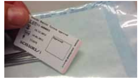
Abb. 4 b

Nach durchgeführter Sterilisation schlägt der auf dem Etikett integrierte Prozessindikator farblich um und kennzeichnet, dass das verpackte Instrument, Set oder der Container einer Sterilisation unterzogen wurde. Die entsprechende Chargenkennzeichnung der erfolgten Sterilisation kann ergänzt und das sterilisierte Sterilbarrieresystem auf dem dafür vorgesehenen Feld für die Lagerung freigegeben werden. Nach der Behandlung oder Operation lassen sich die so genannten Sandwich- oder Duplexetiketten bequem von den verwendeten Sterilbarrieresystemen (versiegelter Beutel, Weichverpackung oder Container) abziehen und in ein entsprechendes Dokumentationsblatt einkleben (Abb. 5). Somit ist für jedes verwendete Instrument, Set oder jeden Container klar ersichtlich, dass es bzw. er verpackt, einem Sterilisationsprozess unterzogen, sichtgeprüft und frei gegeben wurde. Vor der Verwendung der Medizinprodukte ist nochmals zu überprüfen, ob das Sterilbarrieresystem unversehrt bzw. korrekt ver-