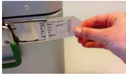
Abb. 4 a